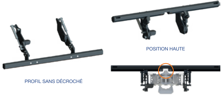
PROFIL SANS DÉCROCHÉ